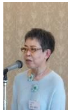
挨拶される黒田支部長