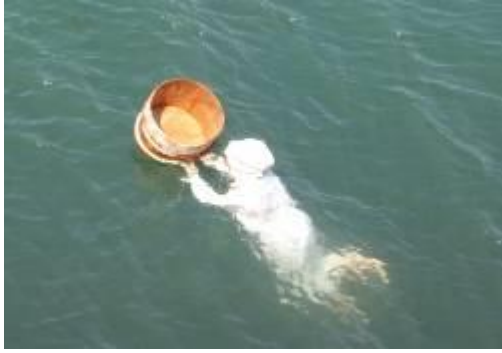
ミキモト真珠島の海女さんの実演